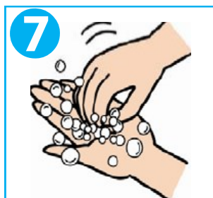
7 手のひらの上で指先を洗う