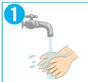
1 流水で汚れを落とす