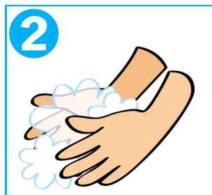
2 石けんを手に取りよく泡立てる