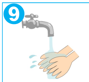
9 石けんを十分な流水で洗い流す