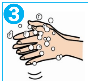
3 手のひらをあわせてこすり洗い