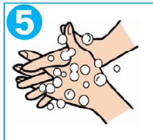
5 指を組んで指の間と付け根部分を洗う