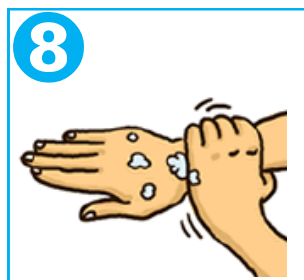
8 手首を握って洗う