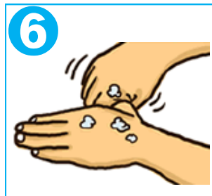
6 親指をねじり洗い