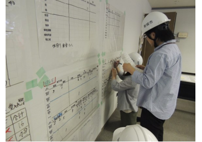
集まった情報を記録する職員

防災訓練は毎年定期的に実施しており、今後発生が予想される南海トラフ地震など、大規模災害発生時に災害拠点病院としての役割を十分に果たせるよう体制を整えていきます。