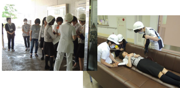
各エリアでの患者対応