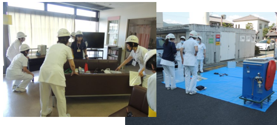
各トリアージエリアの設置

9月2日（金）に地震防災訓練を実施しました。今回は、平日に大地震が発生した想定で訓練を行いました。病院建物や医療器械の被災状況の把握や、災害発生時の医療提供体制の確立についてやトリアージ訓練など、実際に災害が起きた時の動きや問題点を確認しました。