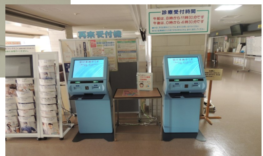
(案内表示システム)