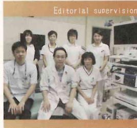
市民病院 内視鏡センター