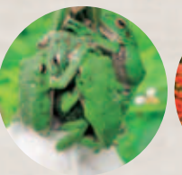
市のカエル モリアオガエル