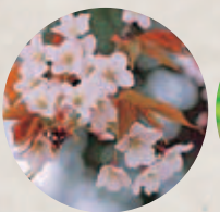
市の木 ヤマザクラ