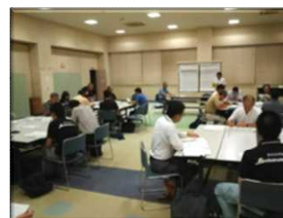
※地域計画策定分科会の様子