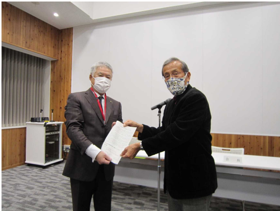
令和2年11月26日(木)市役所4階会議室にて