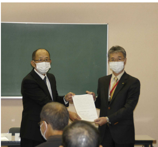
建議書の内容を読み上げ、市長に直接手渡し！

このことにより、令和5年度予算案が新城市議会で議決されれば、来年度事業として実施されることとなりますので、地域の皆様のご理解とご協力をよろしくお願いいたします！！