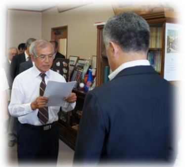
協議会会長から市長へ建議書を手渡す

※「建議」とは・・・地域協議会の主要な役割のひとつ。地域自治区予算の事業計画など地域自治区としての意見をまとめ、市長へ申し立てるものです。地域協議会の主要な役割には「建議」のほか、「地域活動交付金の審査」、「市長からの諮問に対する答申」があります。