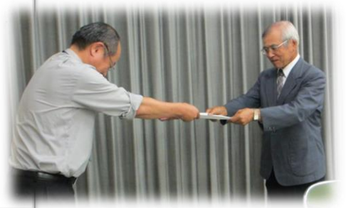
企画部理事（市民自治推進担当）（写真左）から諮問書を受け取る協議会会長（写真右）

※「諮問」とは・・・市の重要施策等で地域に関わるものについて、市長が地域協議会に対し意見を求めることです。 地域協議会は諮問を受け、期限までに諮問事項について協議し、地域としての回答（答申）をしなければなりません。