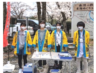
長篠城でのガイド活動の様子 (鳳来中部中高生ボランティアガイドの会)