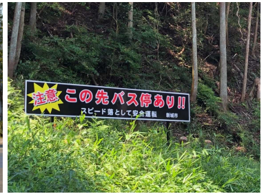
新設されたバス停注意喚起看板 (上大草バス停付近)