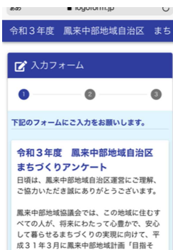
①QRコードからアクセス