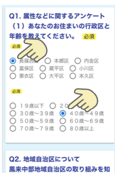
②当てはまるものを選択