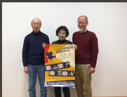
写真：東愛知新聞様による取材の様子

また、趣旨にご賛同いただいた方たちにより、ブログや SNS などこの映画祭のことをご紹介いただき、「こんな企画を待っていた！」という声もいただいております。こういった新聞記事や皆様からの温かいお声は、実行委員の活動の励みとなっています。