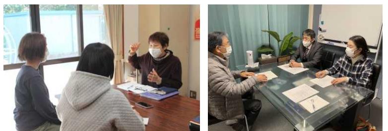
インタビューの様子

東郷のホームページは、東郷の住民の方が作っています。みなさんも「東郷広報PR部」に入部して、東郷の魅力を探したり、地域で輝いている人たちにインタビューを行い、記事を書いてみませんか。※現在は11名の部員がいます。