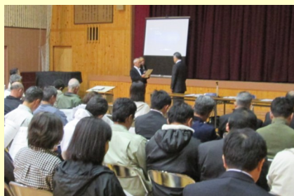
▲地域意見交換会の中で、作手地域自治区予算の事業計画を建議します。(写真は、昨年度の様子)