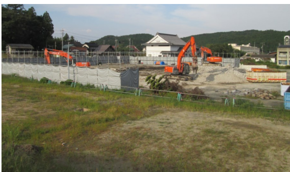
▲山村交流施設建設予定地から望む旧作手総合支所庁舎解体工事の様子