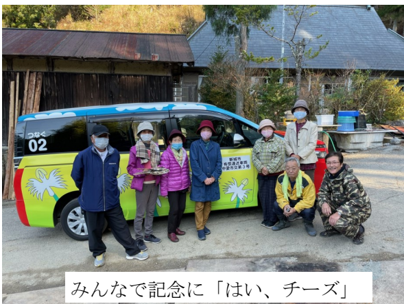
みんなで記念に「はい、チーズ」