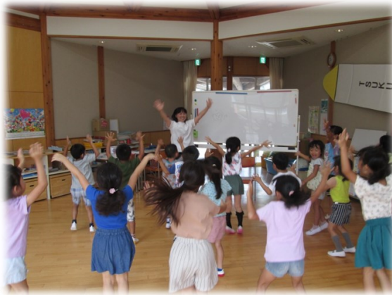
こども園での英語遊び

作手こども園では、平成28年度から始めた3歳以上の園児を対象に英語に親しむ機会づくり(英語遊び)を継続します。