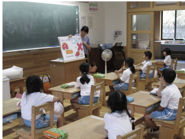
小学校での英語遊び

また、3、4年生の外国語活動及び5、6年生の外国語(英語)の授業では、教員を支援するアドバイザーを派遣し、指導方法について共に考えていきます。