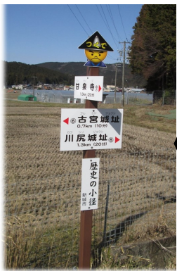
道しるべ看板の更新