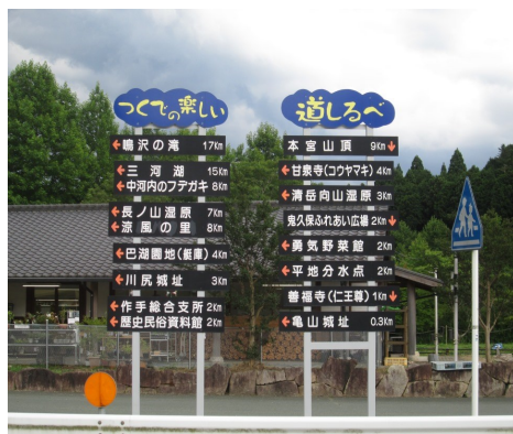
市場地内(手作り村前)の看板状況

作手地域の玄関口となる3カ所(和田、市場、田原)に、観光案内看板が設置されています。このうち田原地内に設置されている看板が老朽化が著しいため更新を行います。