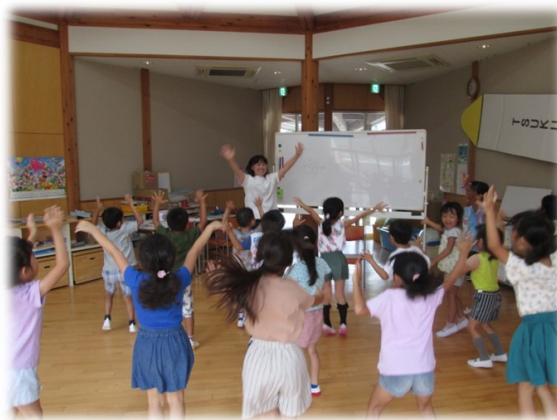
こども園での英語遊び

す。 また、3、4年生の外国語活動及び5、6年生の外国語(英語)の授業では、教員を支援するアドバイザーを派遣し、指導方法について共に考えていきます。