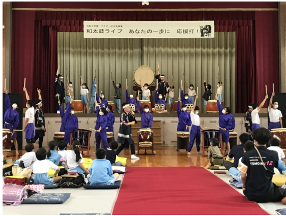
今年の様子「和太鼓 志多ら」と一緒に

つくでっ子元氣事業は、小学生を対象に、スポーツ・文化等の講習会、講演会、鑑賞会等を行い、学習意欲の向上及び地域の人たちとの交流を図る事業です。平成26年度からの継続事業で、毎年6月の共育の日に実施しています。今年度は、3年ぶりに小中学生が一緒に行うことができました。 来年度は、初となる舞台劇、劇団うりんこによる「わたしとわたし、ぼくとぼく」を企画しています。