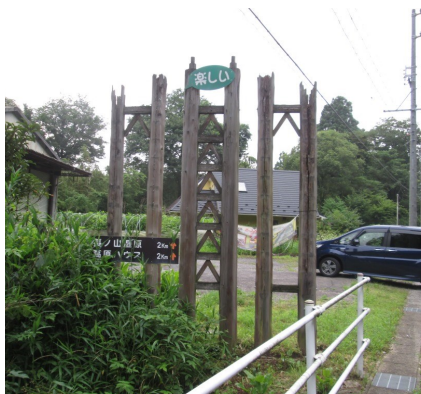
更新する田原地内の看板