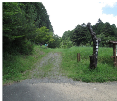
砂利が流れ出す 登り口

亀山城址の遊歩道は、平成30年度から3カ年で、急な部分に階段を設置するとともに、カラー舗装(滑り止め防止)を行い、亀山城址を訪れる方が安全に登れるよう整備を行いました。