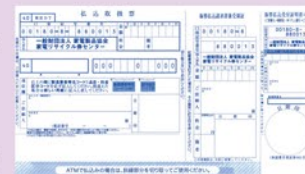
家電リサイクル券