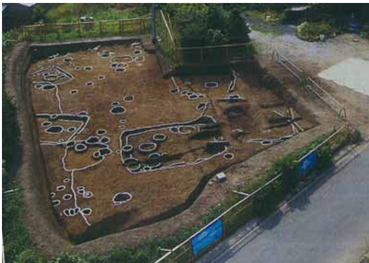
写真：調査箇所の状況 吉竹遺跡(新城市牛倉) (財)愛知県埋蔵文化財センター説明会 資料より

昨年度までに、場所を特定するための試掘調査をしました。今年度は事業予定地内で確認された8箇所中7箇所の本調査を実施する予定です。1年では終わらない箇所もありますので来年にかけて調査をいたします。調査作業中は近くの皆様にはご迷惑をおかけします。すでに牛倉の吉竹遺跡の今年度調査分は6月上旬に調査完了しています。15日に牛倉区の皆様に説明会を実施させていただきました。