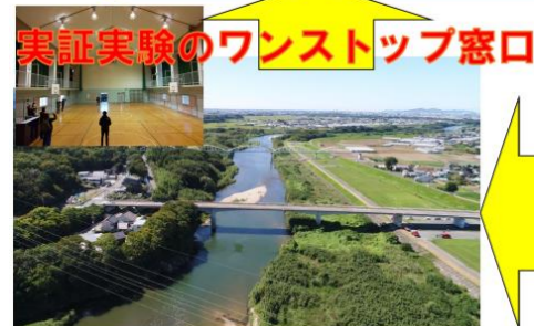
河川上空を始めとするフィールド