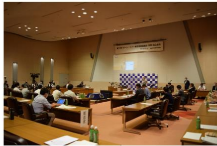
協議会設立総会の様子

ものづくりの人材が揃い、かつコンパクトな地理的条件を生かし、経済活動を支える多様な団体と行政が一体となってドローン・エアモビリティに関する新産業の集積を図り、地域経済の活性化と地域課題の解決に取り組むため、推進主体となる「東三河ドローン・リバー構想推進協議会」を令和2年8月1日に設立しました。