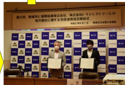
地域外企業との連携