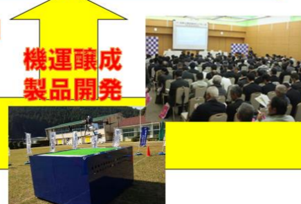
地域内での社会実装に向けた取り組み