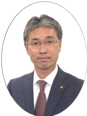
新城市長 下江 洋行