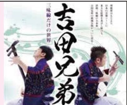
主催：新城市・新城市教育委員会

その他プレイガイド等お問い合わせは新城文化会館 TEL0536-23-2122へ