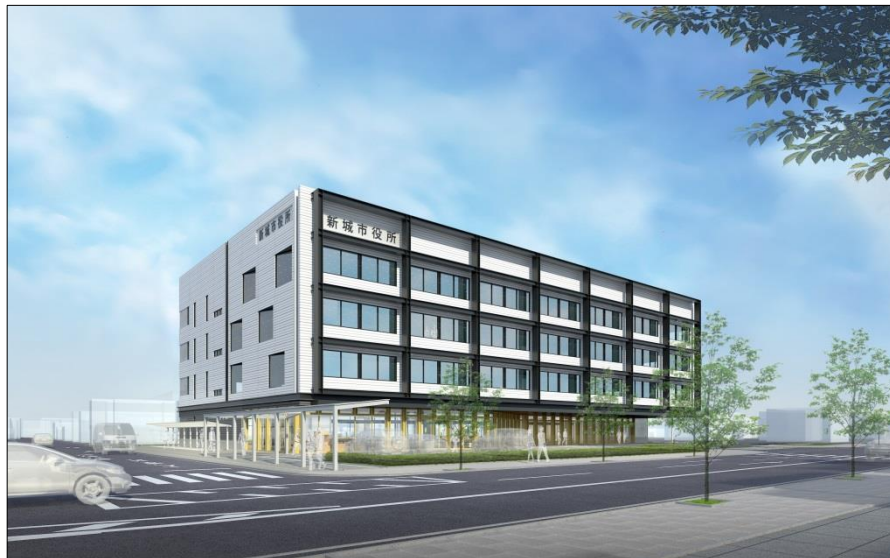
新庁舎完成イメージ図